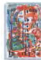
Aprenda a organizar actividades