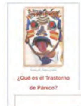
¿Qué es el Trastorno de Pánico?