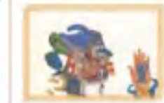
¿Cómo afrontar el Duelo?