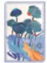
Afrontando el estrés