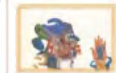
¿Cómo afrontar el Duelo?